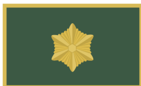
Maleva pealiku abi Ringkonnavanema abi, Malevkonna pealik, jaoskonnavanem Noorteinstruktor