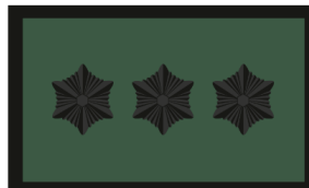
Rühmapealiku abi Rühmavanema abi