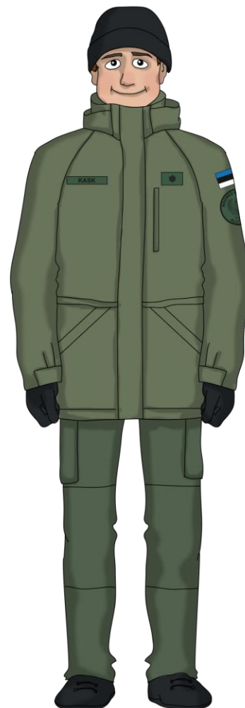
Talvemütsi kandmine jopega