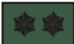
Malevkonna pealiku abi Jaoskonnavanema abi