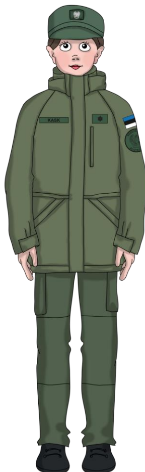
Nokkmütsi kandmine jopega